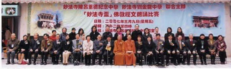
比賽完滿結束，全體擔任評判的校長與嘉賓大合照。

為推廣佛化教育，並加強與友校聯繫，妙法寺屬校劉金龍中學與陳呂重德紀念中學聯合舉辦全港「妙法寺盃」佛教經文朗誦比賽。